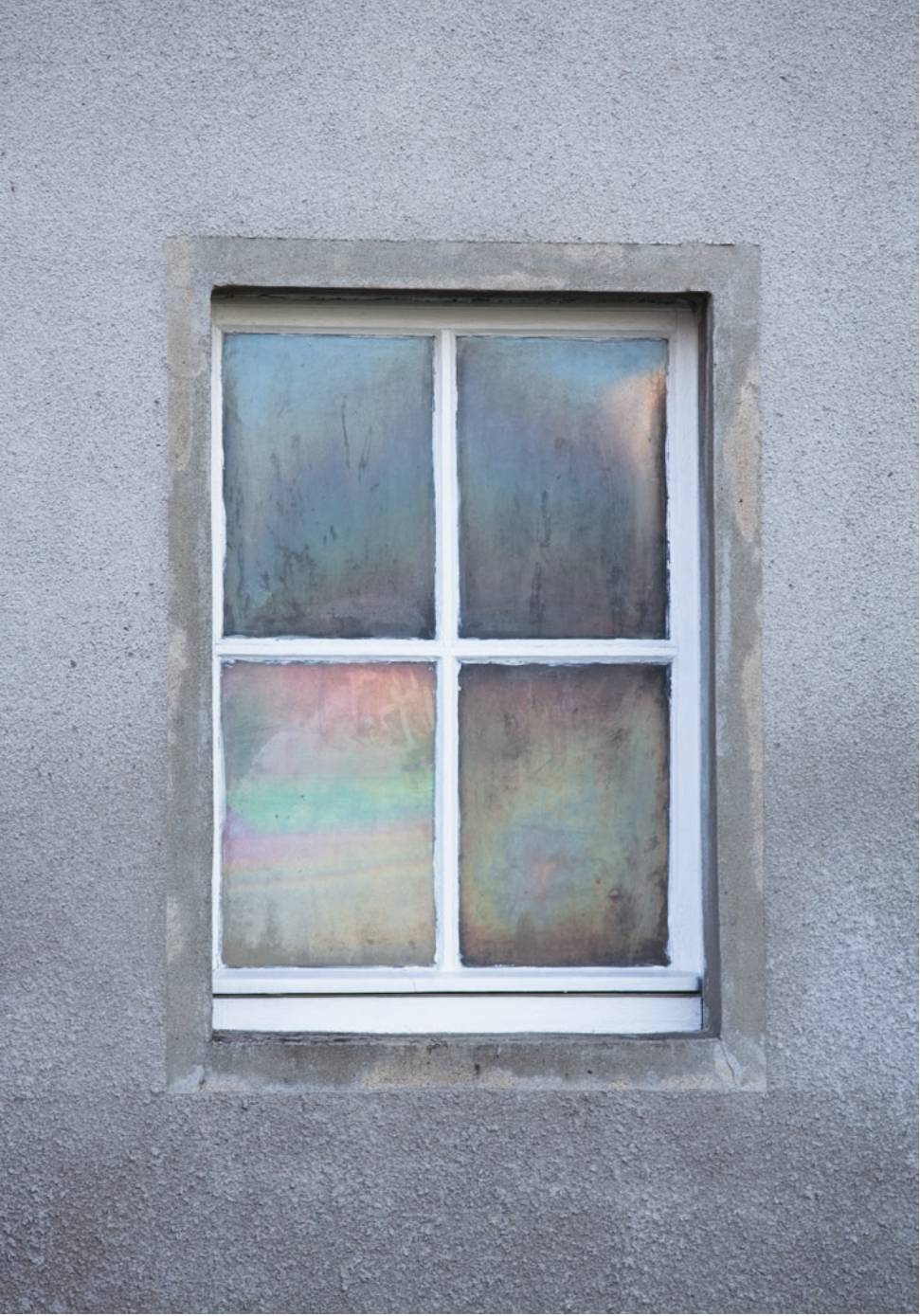
| BUCHENWALD #16, 2008 / PIEZO-PRINT 50 x 40 CM