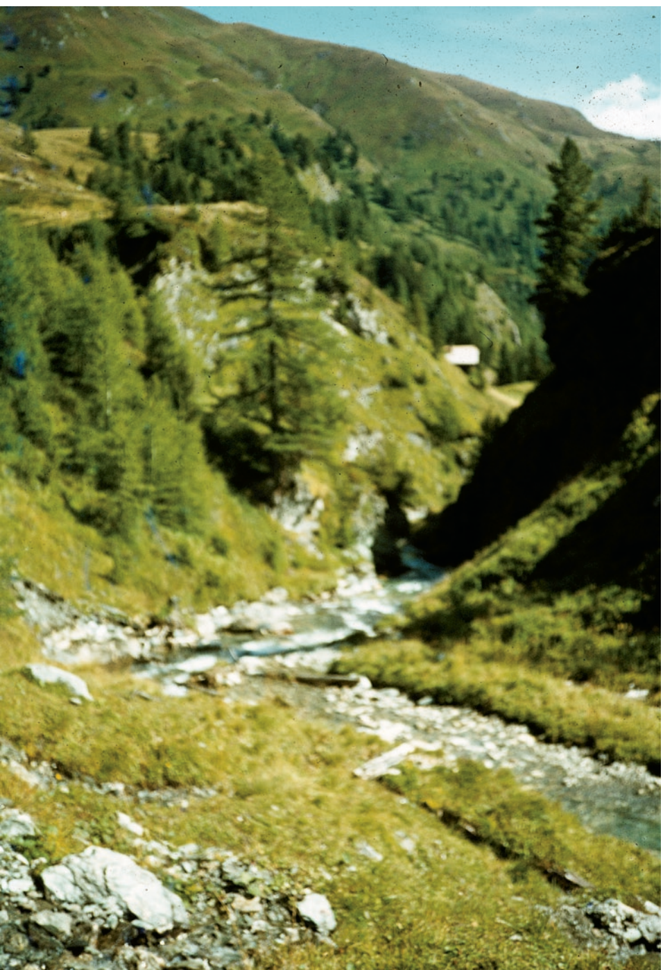
| Bergbach, 2006 / LAMBDA-AUSBELICHTUNG 20 x 30 CM