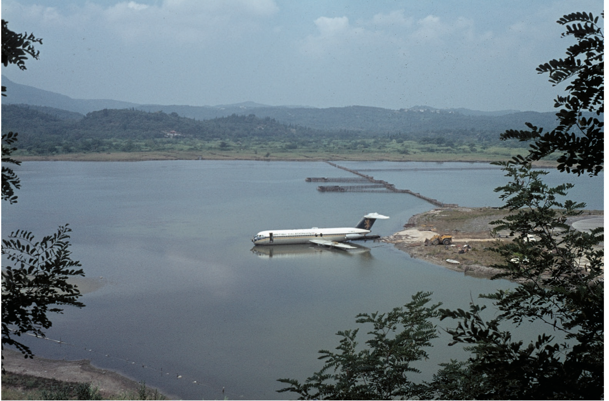
FLUGZEUG IM WASSER, 2006 / LAMBDA-AUSBELICHTUNG 75 x 106 CM