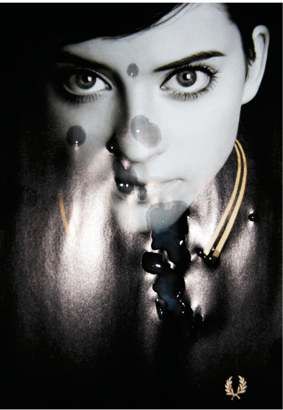
| WICHSVORLAGE, 2006 / LAMBDA-AUSBELICHTUNG 49 x 34 CM