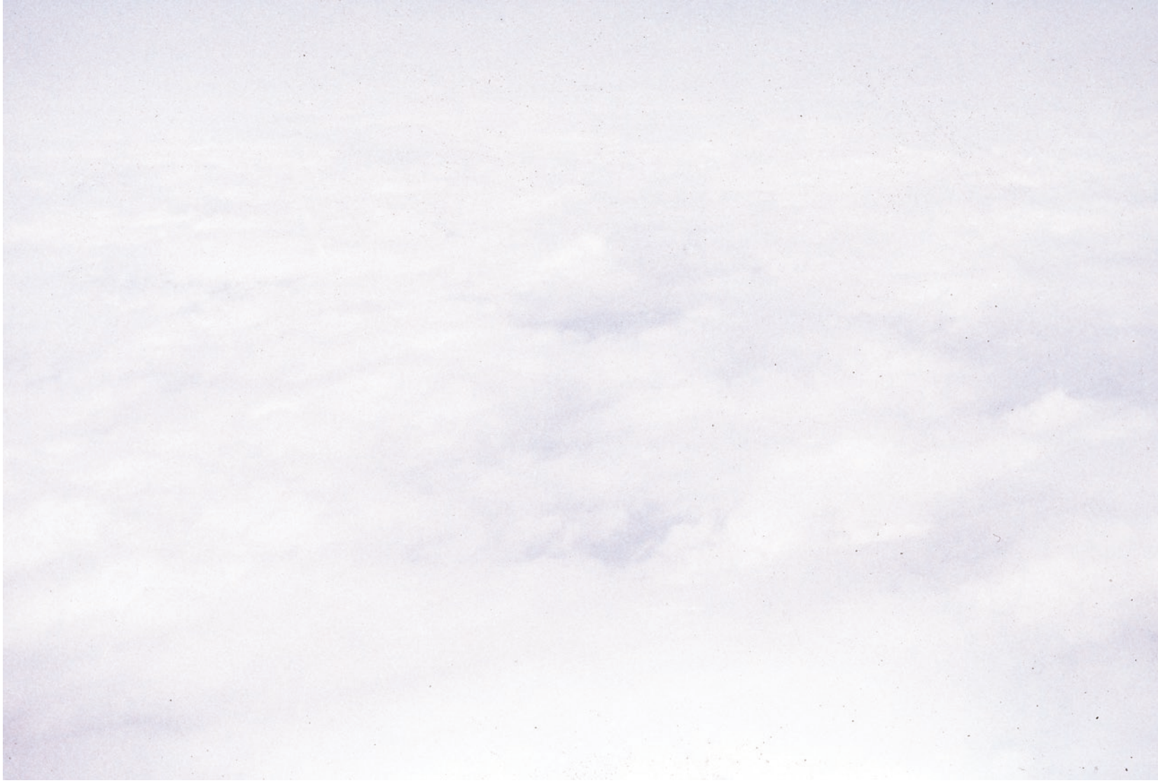
UFOWOLKE, 2006 / LAMBDA-AUSEBELICHTUNG 75 x 107 CM