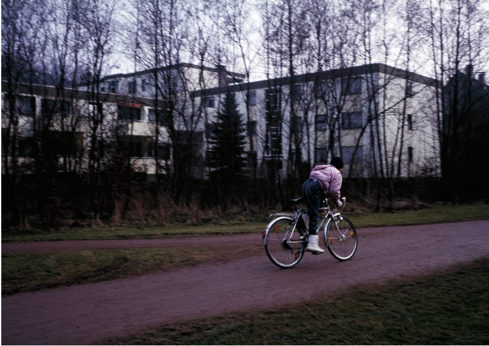
| RADFAHRER, 2006 / LAMBDA-AUSBELICHTUNG 46 x 63 CM